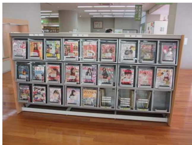
中央図書館雑誌コーナー